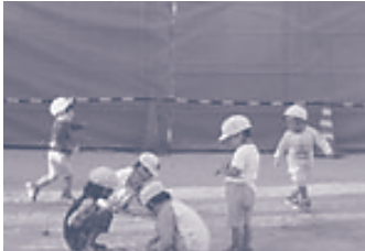
南保育園の園庭で元気に遊ぶ児たち

これまでから医務室のエアコン設置は、園児の健康管理からも不可欠と粘り強く求めてきました。引き続き、すべての保育室にエアコンを設置させるために、議会で取り上げていきます。