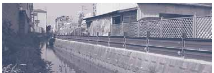
京阪バス門真支所の東側を流れる門真第11水路に設けられた側壁

「雨が激しく降ると水路から家屋に浸水する。何とかして欲しい」と地域住民から要望がされ、担当部に改善を申し入れ水路側壁を高くしてもらい、周辺のみなさんから喜ばれています。