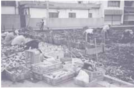
レンコン試験田の収穫作業風景

これまでからJA北河内の門真地区営農研究会のみなさんが、「河内レンコン」の生産と供給、環境保全など都市農業の確立に向けて取り組まれてきました。