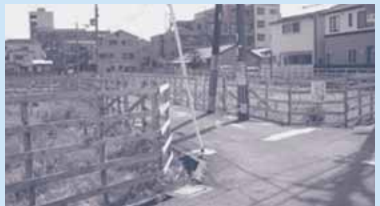
公園整備が予定されている月出市営住宅跡地